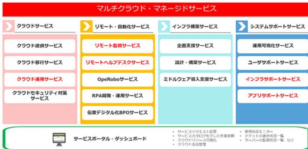
「マルチクラウド・マネージドサービス」メニュー